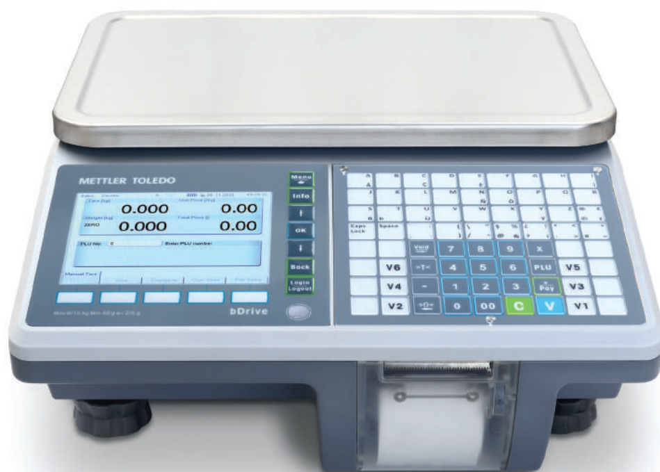
Bilancia compatta bDrive

Grazie alla rapidità e accuratezza della pesatura e della manutenzione, il modello bDrive di METTLER TOLEDO è una versatile bilancia da banco vendita multifunzione dotata di sistema di stampa scontrini, adatta alle attività di rivendita in negozi e soluzioni mobili. Progettata per garantire rapidità e lunga durata, la bilancia bDrive consente ai retailer di effettuare operazioni di pesatura complete e migliori che riducono i tempi di attesa dei clienti; il modello resiste inoltre ad ambienti con condizioni difficili.