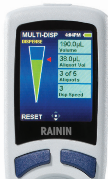
E4 XLS+ в режиме многократного дозирования