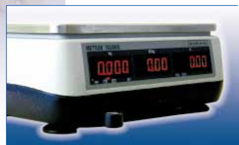
Visor del lado cliente, siempre todo a la vista.