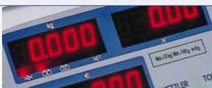
Visor LCD de gran legibilidad