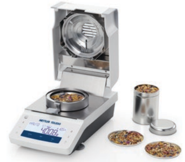
使い捨てアルミ皿