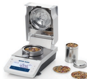
Couppelles en aluminium