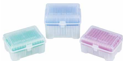
リサーチグレード ピペットチップ