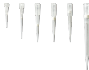
クリーンさを保証

■ 適合表 (2ページ目にも記載があります) サンプルチップ依頼受付中 ▶ www.mt.com/JP-RG_sample