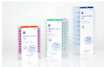
リサーチグレード 詰め替え用チップ