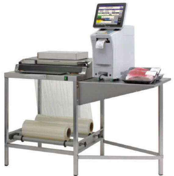
840 versione 30 kg su postazione di confezionamento manuale

METTLER TOLEDO offre supporto alla distribuzione alimentare per l'intero ciclo di vita delle soluzioni da laboratorio di lavorazione dei prodotti freschi, dalla consulenza sull'acquisto dei prodotti, all'installazione e all'implementazione di strumenti e sistemi, fino alla manutenzione e ai servizi post-vendita, come l'offerta di consumabili.