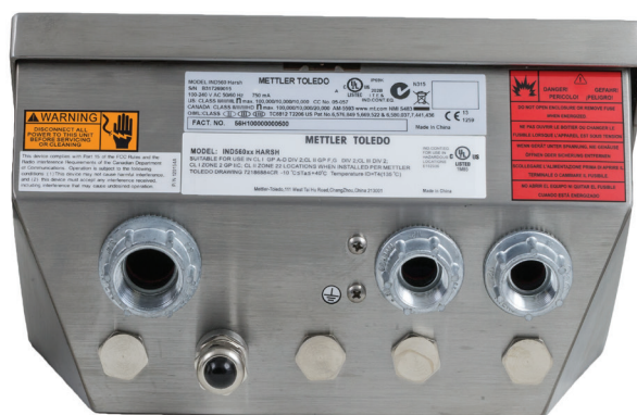
[Modèle UL montré]