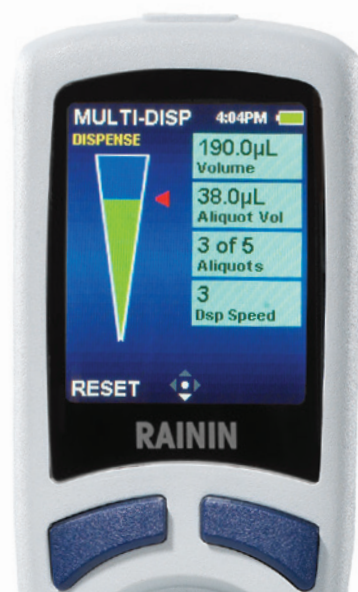
E4 XLS+ in modalità multifidosaggio