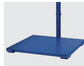
Plaque de charges