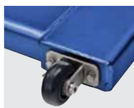
Trousse de roues