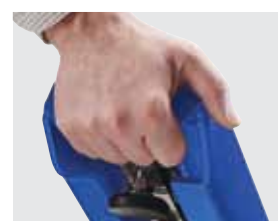
Poignées de levage intégrées