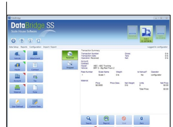
Gebruiksvriendelijke interface Touchscreen