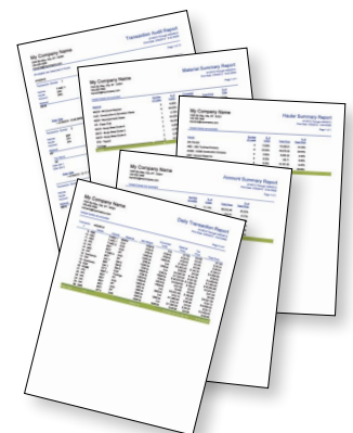
Efficiënte rapporten Samenvatten met één klik