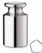
△ Проволочная гиря ■ Цельнолитая гиря с головкой