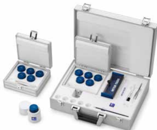
Набор гирь, набор гирь с принадлежностями и отдельные гири