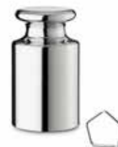
△ Проволочная гиря ■ Цельнолитая гиря с головкой