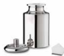
□ Пластиночная гиря ■ Гиря с головкой и подгоночной полостью