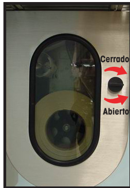
Puerta de acceso

Usar un trapo limpio humedecido con agua tibia para limpiar las superficies exteriores. No rociar líquidos ni usar solventes o limpiadores directamente sobre la unidad.